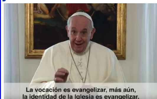
La vocación es evangelizar, más aún, la identidad de la Iglesia es evangelizar.

https://www.diocesisdesalamanca.com/noticias/la-cruz-de-los-jovenes-visitara-de-nuevo-salamanca-el-13-de-octubre/