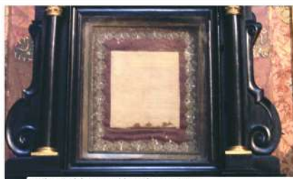
Reliquia del corporal bañado en Sangre