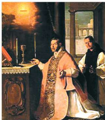
Francisco de Zurbarán, representación del Milagro

Durante la celebración de la Misa, una Hostia consagrada derramó gotas de Sangre. El Prodigio contribuyó a fortalecer la fe del sacerdote y de muchos fieles, entre ellos, el mismo rey de Castilla. Son numerosos los documentos que dan testimonio de este Milagro. Las Reliquias del Prodigio fueron expuestas para la veneración de los fieles durante el Congreso Eucarístico de Toledo en 1926 y sigue siendo hoy en día objeto de profunda devoción para el pueblo español.