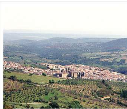
Vista de Guadalupe