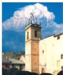
Iglesia de San Santiago Apóstol en Onil, donde se conserva la Hostia Milagrosa