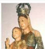
La Virgen del Prodigio