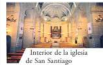
Interior de la iglesia de San Santiago