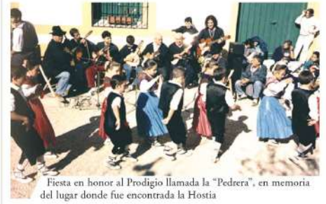
Fiesta en honor al Prodigio llamada la "Pedrera", en memoria del lugar donde fue encontrada la Hostia