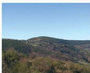
Vista panorámica de O'ebreiro