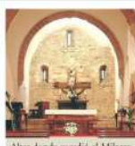
Altar donde sucedió el Milagro