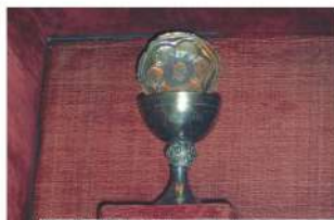
Reliquia del Cáliz, de la Patena y de la Santa Sangre del Milagro

El Señor obró este Prodigio para sostener la poca fe del sacerdote que no creía en la presencia real de Jesús en la Eucaristía. Las Sagradas Reliquias del Milagro se conservan hasta el día de hoy en la iglesia donde sucedió el Prodigio. Cada año, son muchos los peregrinos que acuden para venerar este Milagro.