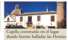
Capilla construida en el lugar donde fueron halladas las Hostias